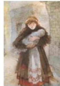
een moeder, Ilse Buizer